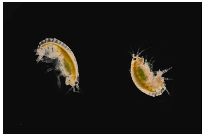
Abb. 1. Der Mexikanische Flohkrebs Hyalella azteca.

den in der Literatur beschriebenen BCF-Werten für Fische aufweisen ( r^2 = 0,69 ) (Schlechtriem et al. 2019). Die BCF-Werte von Hyalella können nach dem Standard-B-Kriterium (BCF > 2000) bewertet werden und ermöglichen damit die Vorhersage einer B- oder Nicht-B-Einstufung im Standard-Fischtest. Die Testmethode hat somit ein hohes Potenzial als alternative Methode für die Bioakkumulationsbewertung.